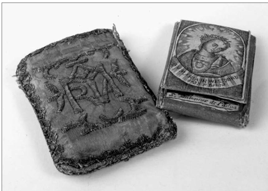
Pověrečný, tzv. nepravý škapulíř, hedvábný sáček s mariánským monogramem zavěšovaný na krk pod oděv. 18. století

Magické praktiky, předávané ústní tradicí i psanou formou (čarodějné knížky), čerpaly z různých kulturních zdrojů, od antiky až po novověk. Je nesnadné odhadnout, jak široké vrstvy jimi byly zasaženy. Podle prostředí, které lidi formovalo, a podle individuálního charakteru někteří slepě věřili, jiní se vysmívali. Už ve středověku měly magické praktiky kritiky. O naprosté vyhlazení magie usilovala reformace. Zákazem zobrazivého umění, důrazem na duchovní stránku náboženství a omezením hmotných symbolů magií z každodenního života částečně vytěsnila. Víru v temnou moc čarodějnic jako služek a pomocnic samého ďábla však nevyvrátila a ani Jan Amos Komenský o jejich existenci nepochyboval.