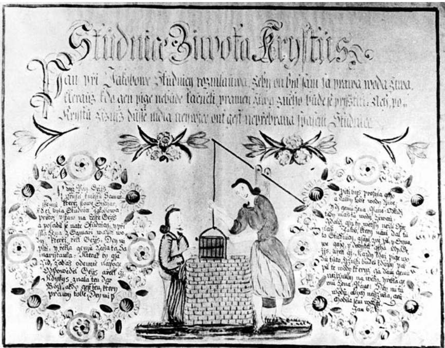
Domovní požehnání. Setkání Krista se Samaritánkou u studně Jákobovy z nekatolického prostředí v okolí Skutče. Konec 18. století

dobí, posléze tolerance. Reformace odmítla zobrazivé umění (až do krajnosti obrazoborectví), a zbavila tak široké vrstvy negramotných křesťanů vizuálního prožívání. Nahradila je silou slova kázaného v mateřském jazyce a memorováním zlatých textů vytržených z Bible, které měly napomáhat v řešení životních situací: Co nemáš sám rád, nečiň jinému nebo Uval na Hospodina cestu svou a slož v něm naději, on zajistí všecko správi apod. Dědictvím reformace, z něhož těžila posléze doba barokní, byl rozvoj zpěvnosti, písňové vzdělanosti a kůrové hudby vůbec. Počet sedmi svátostí zredukovala reformace na dvě, totiž křest a přijímání. Svatým patronům upřela divotvornou moc a prohlásila je za pouhé příkladným životem žijící smrtelníky, hodné následování. Kult svatých byl přitom charakteristickým prvkem lidové zbožnosti od raného středověku, data jejich svátků sloužila též jako orientační