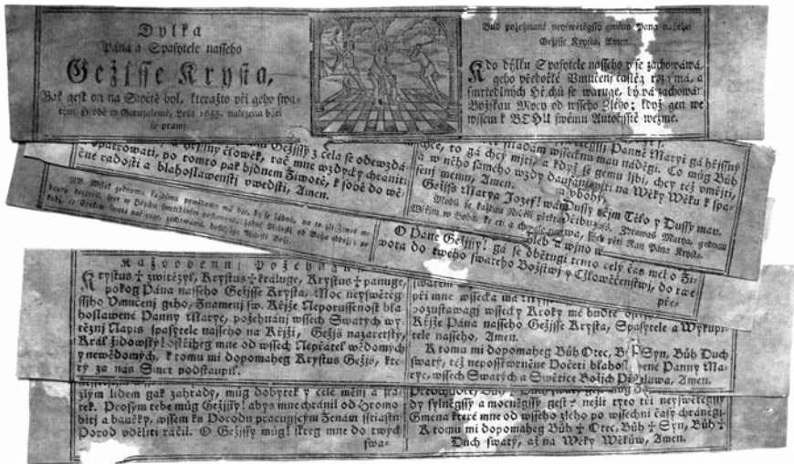
Délka Ježíše Krista. Ochranný amulet z pěti papírových proužků dřevorezu s výjevem bičování Krista v údajné délce Kristova těla. Konec 18. století

jího. 6) Stejně jako náboženství je založena na víře, a to na víře v empiricky neověřitelné kauzální spojení mezi aktem a žádoucím výsledkem. Magické konání, jeho pravidla a postupy, gesta a symboly, vyžaduje zasvěcení (odbornost) a podléhá závazným principům tak jako (pseudo)vědecký postup. V tradiční společnosti postupovalo nejružnějšími situacemi každodenního života. Přitom nestálo proti církevní praxi, ale existovalo nezávisle vedle ní, často v symbióze. Uctívání svatých a Panny Marie, poutní praktiky, užívání svátostin k ochranným a léčebným účelům, mísení svatých jmen do zaklínadel a zařikání jsou toho důkazem. Od středověku rozšířené votivní darování (dary záslibné a děkovné) je přímo založeno na magickém principu obdarování: dar musí být vzájemně oplácen. Církev do jisté míry tolerovala užívání svěcenin a žehnaných předmětů v lidových praktikách ochranné a léčebné magie, ale spíše jen z blahovůle a vstřícnosti některých kněží vůči farníkům. Nikdy však nepřipustila existenci aktérů magického konání, údajně nadaných schopnostmi vejít ve styk s nadpřirozenem a ovládat jiné lidi, zvířata, přírodní jevy a úkazy. Osoby, které takto vystupovaly